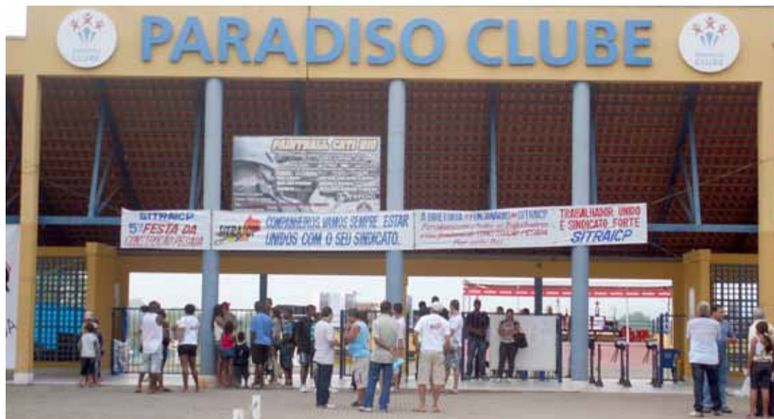
Este ano, a festa dos trabalhadores será no mesmo clube, no bairro de Cabuçu

As inscrições já começaram. Vão do dia 3 até 31 de outubro, das 8h às 19h, de segunda a sexta-feira, e aos sábados até 12h. Vale lembrar que só poderão participar os associados e seus dependentes legalmente inscritos. Não há exceção para pessoas estranhas ao quadro social do sindicato. Pretendemos oferecer o que de melhor para os trabalhadores e seus familiares. Portanto, venha participar dessa alegria. Maiores informações serão prestadas na sede do sindicato.